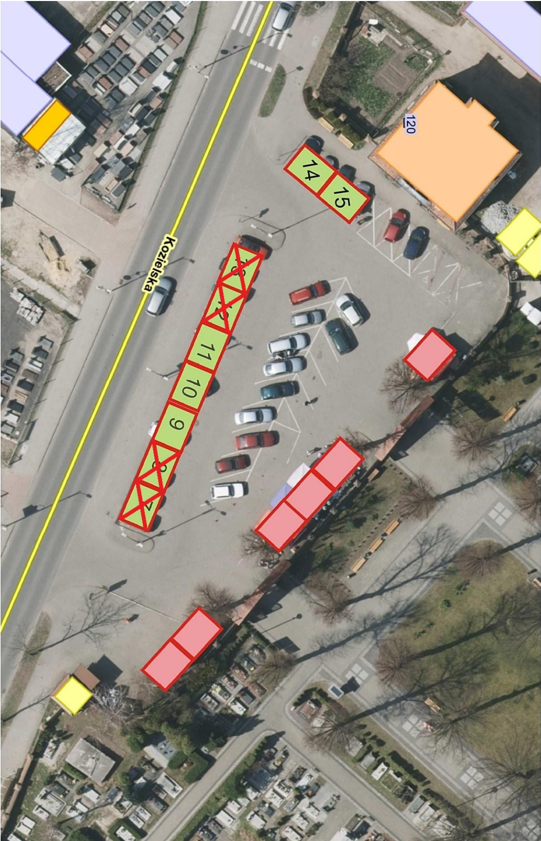
Załącznik nr 3 Cmentarz Centralny od ul. Kozielskiej